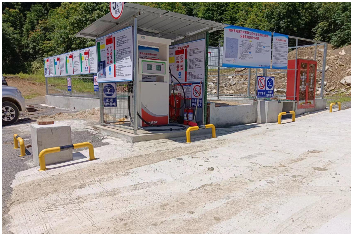
图 2.5-1 现场照片